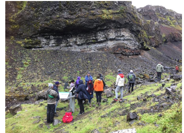
Einn þekktasti fundarstaður steingervinga á landinu -milljón ára gróðurleifar (risafura, hlynur, magnolía og beyki).

Fjölskrúðugt dýralíf Reyniviður og birkiskógur