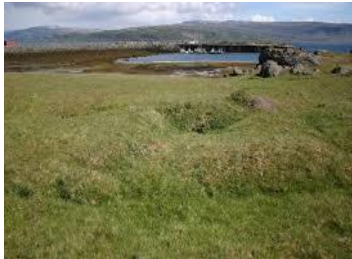
Landnámsbærinn Eyri Kuml

Fyrsta tilraunin til landnáms sem sögur fara af á Íslandi.